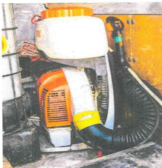
Рисунок 9 - Ранцевый моторный опрыскиватель

жидкости на мелкие капли в потоке воздуха большой скорости, создаваемом вентилятором) (рисунок 9). Ширина рабочего захвата при этом не должна превышать 5 м.