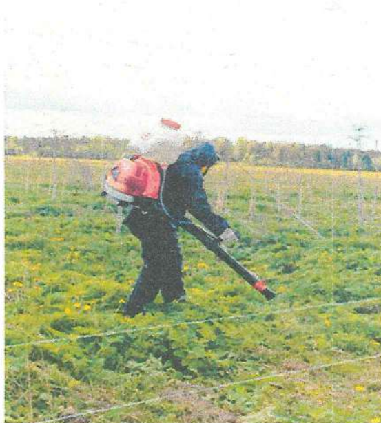
Рисунок 8 – Проведение обработок

6. Однократная обработка (рисунок 8) баковой смесью гербицидов Флоракс, КС (0,4 л/га) + Магнум, ВДГ (15 г/га) + Витанолл, Ж (50 мл/100 л рабочего раствора). Опрыскивание проводится в ранние фазы роста борщевика, при средней высоте 20-40 см.