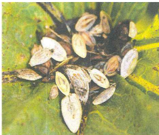
Рисунок 2 – Семена борщевика Сосновского

Почти все семена, появившиеся в конце лета, имеют недоразвитый эмбрион. Они вызревают при воздействии низких среднесуточных температур (2-4°C) в течение 1-2 месяцев, во влажной среде. Поэтому новые семена осенью не прорастают, им необходим период покоя. Основная масса семян располагается в верхних слоях почвы на глубине 5 см. Жизнеспособность семян сохраняется до 5 лет.