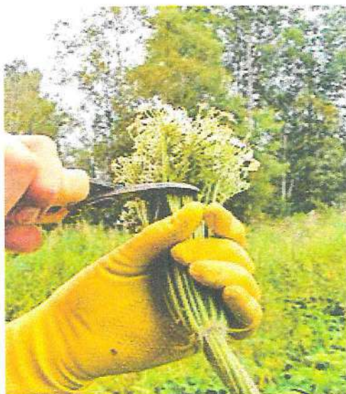
Рисунок 5 – Обрезка цветков борщевика

При более ранней срезке будет происходить сильное отрастание, а при более поздней велика вероятность дозревания семян в уже срезанных растениях, поэтому срезанные растения необходимо уничтожить сжиганием [4].