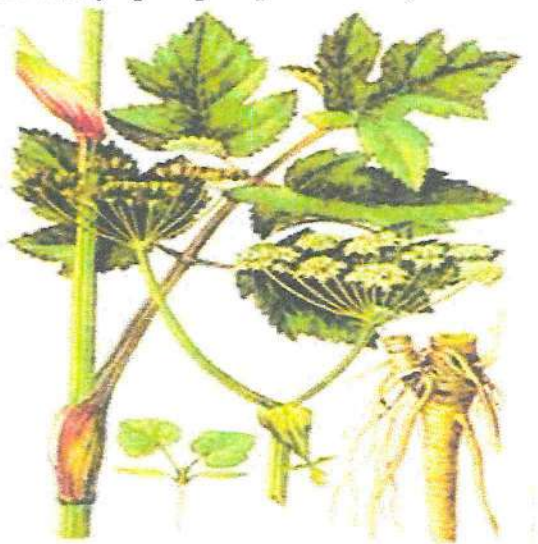
Рисунок 1 – Борщевик Сосновского

Корневая система борщевика Сосновского стержневая. Основная масса корней находится на глубине 30-50 см. Радиус распространения корневой системы может