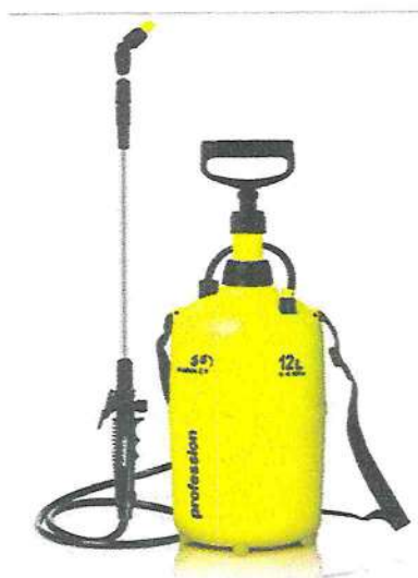
Рисунок 10 - Ручной ранцевый опрыскиватель

При небольших объёмах обработок используется ранцевый опрыскиватель с объёмом бака 12 литров (рисунок 10).