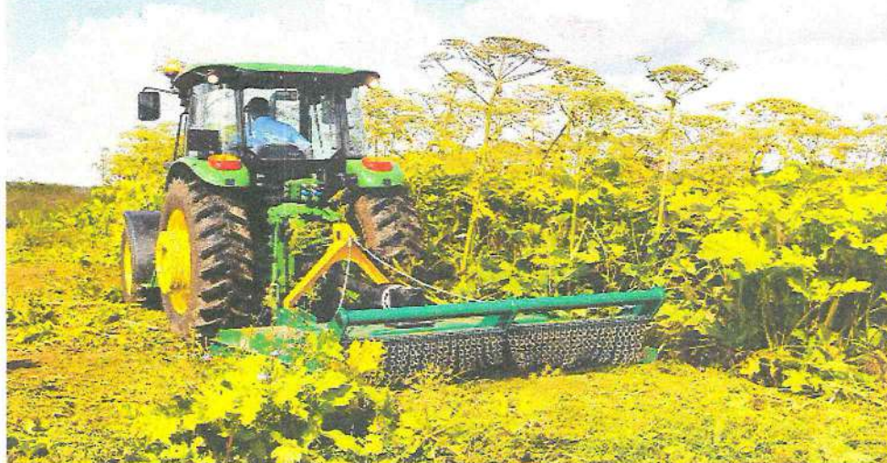
Рисунок 3 – Механизированное скашивание борщевика Сосновского

Как способ искоренения борщевика рассматривают также скашивание (рисунок 3). Однако, как показывает практика, многократное скашивание растений борщевика Сосновского, даже на протяжении нескольких лет, не оказывает значимого воздействия на численность популяции растения. После каждого скашивания на материнском растении из корневых почек отрастают новые молодые побеги. Скашивание эффективно только для предотвращения цветения и образования семян и может быть использовано для создания буферных зон, предотвращающих попадание новых семян на освобождаемую территорию.