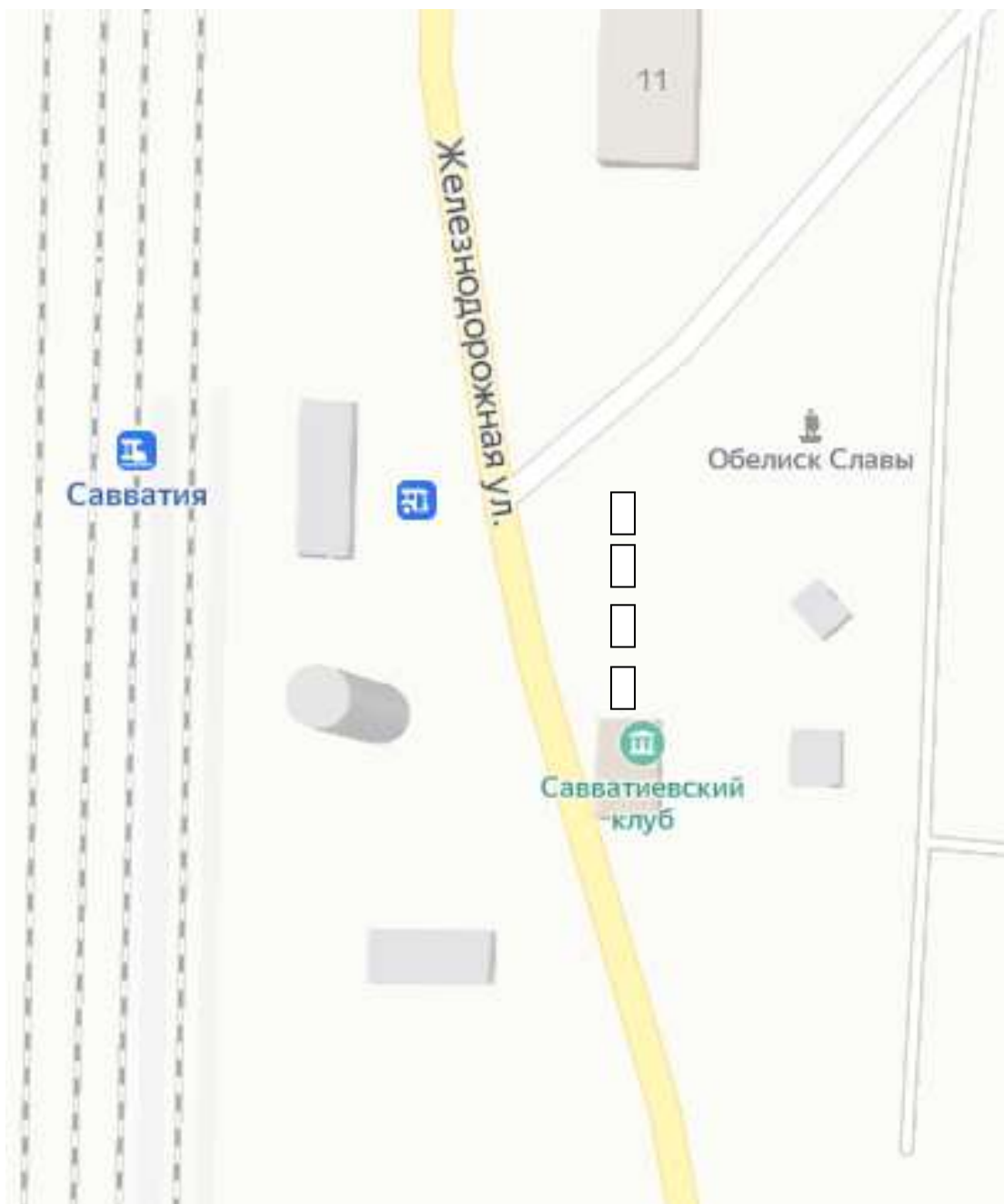
Схема проведения ярмарки