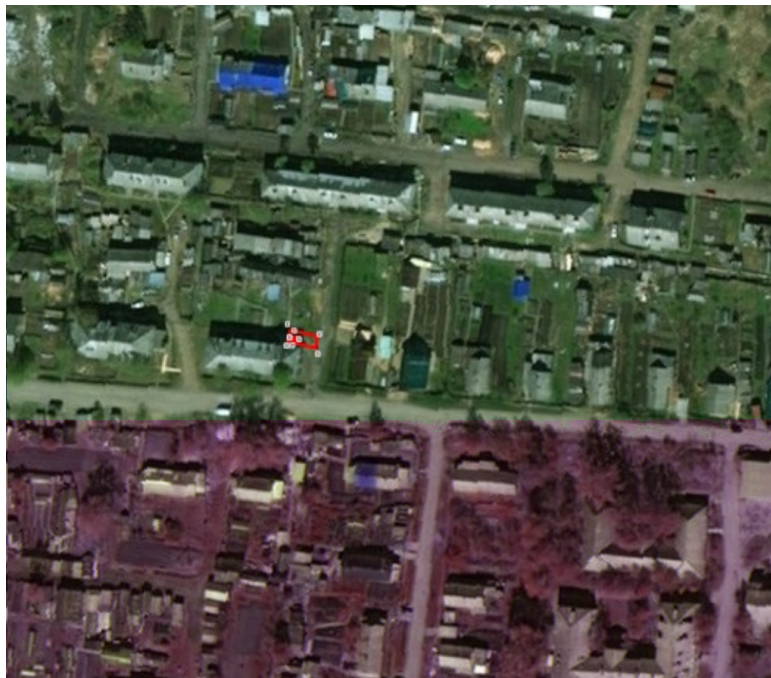
Каталог координат поворотных точек