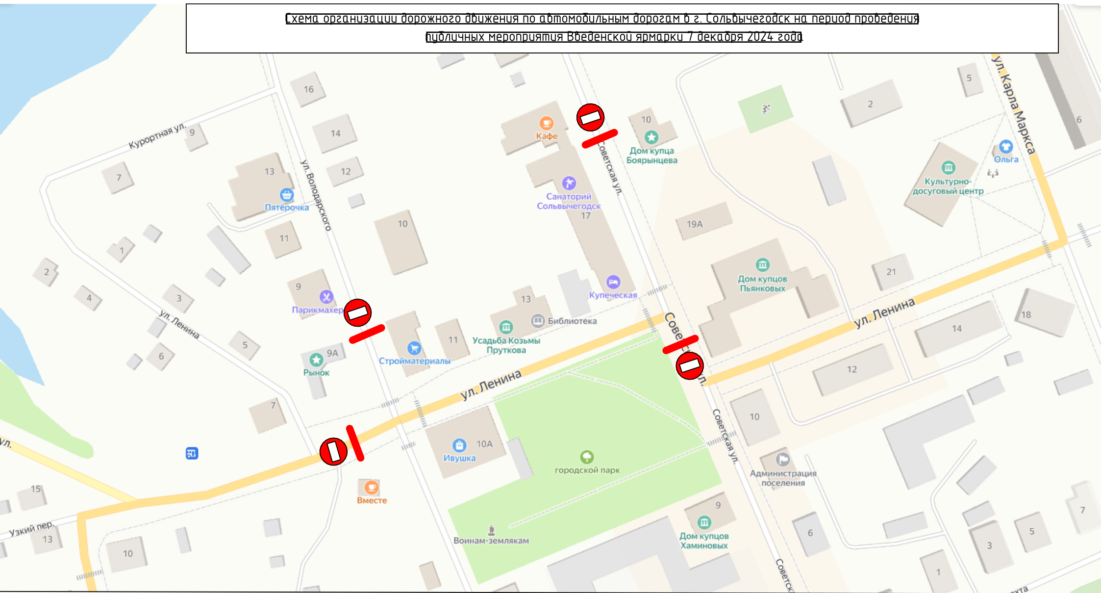
Схема организации дорожного движения по автомобильным дорогам в г. Сольвычегодск на период проведения публичных мероприятия Введенской ярмарки 7 декабря 2024 года

Ответственный за установку знаков и ограждений